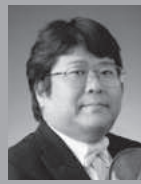
森田昌弘 (2nd Vn) Morita Masahiro NHK交響楽団首席